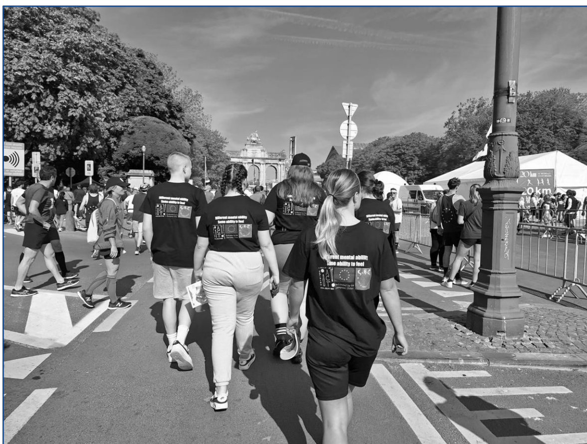
iACT-ovci sudjeluju na maratonu u Bruxellesu kako bi podigli svijest o mladima s posebnim potrebama